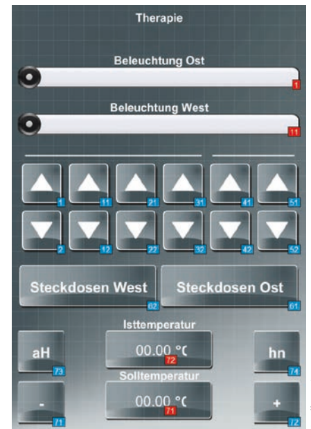
Bild 3: Die Bedienoberfläche mit großen, kontrastreichen Buttons wurde eigens an den Kunden angepasst

All das definiert die internationale Norm über den Kunstbegriff »AAL«. Es wäre